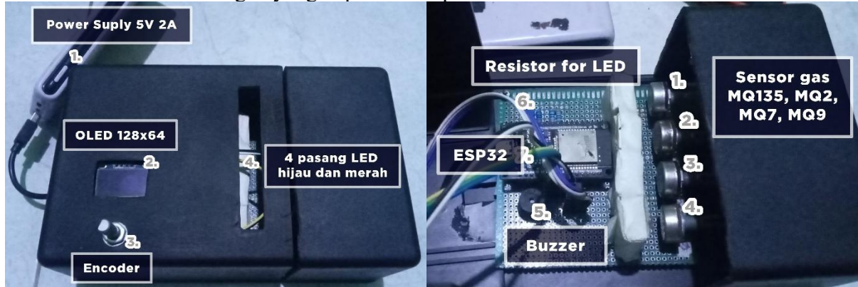
Gambar 3. Prototipe alat uji emisi (a). Tampak luar (b). Tampak dalam

Setelah alat dibuat dilakukan pengujian dimasing-masing bagian dengan tujuan melihat kinerja dari tiap blok, serta pengujian secara keseluruhan untuk mengetahui performa alat yang telah dibuat. Hasil rancangan yang dapat dilihat pada Gambar 3.