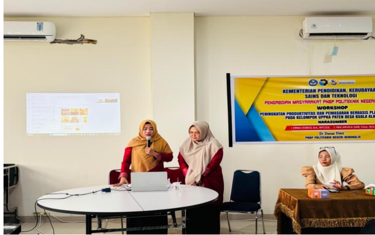
Gambar 3. Pemaparan materi tentang pentingnya Canva dan Capcut sebagai promosi kreatif UMKM.