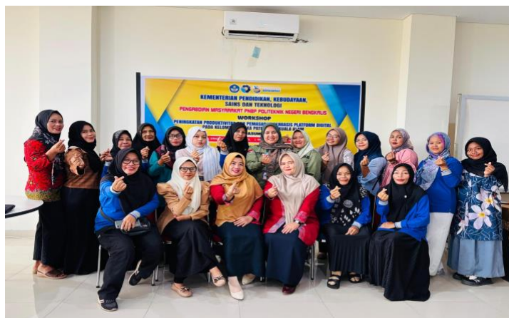
Gambar 3. Foto Bersama dengan seluruh peserta workshop