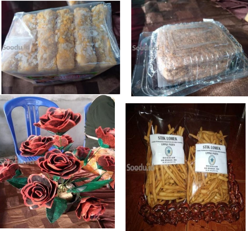
Gambar 1: Hasil produksi makanan dan kerajinan tangan UPPKA Paten

Meskipun memiliki potensi yang menjanjikan, usaha UPPKA masih dihadapkan pada berbagai tantangan utama. Beberapa di antaranya meliputi tingkat produktivitas yang masih rendah, kurangnya inovasi dalam menciptakan dan mengembangkan produk, serta terbatasnya akses ke pasar yang lebih luas.