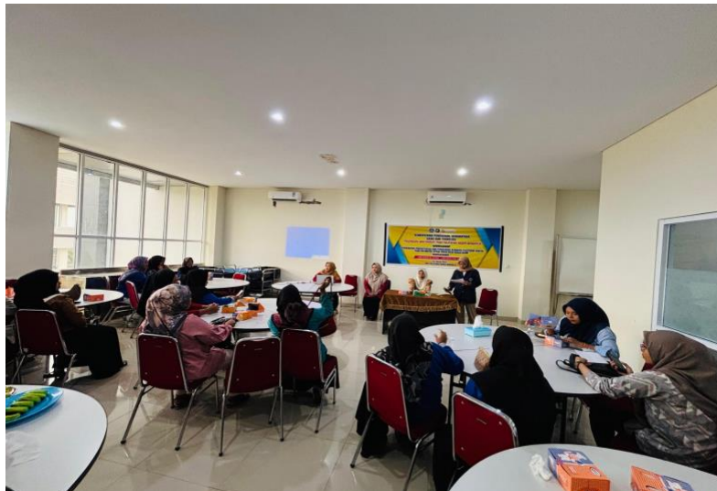
Gambar 2. Peserta pelatihan praktek penggunaan aplikasi canva dan Capcut