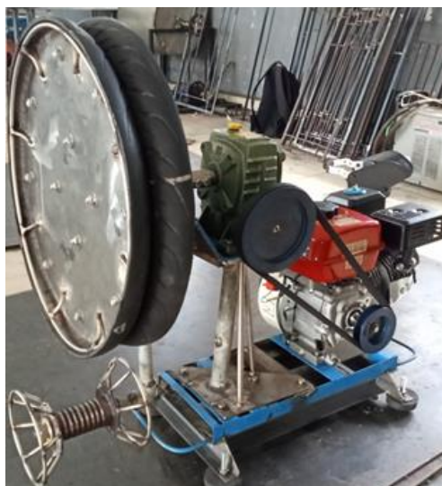
Gambar 3.2 Konstruksi 1 unit alat penarik jaring nelayan dengan penggerak motor bensin dengan gear box sebagai robot penarik jaring

Solusi yang ditawarkan untuk penyelesaian permasalahan yang dihadapi mitra adalah dengan menerapkan Mekanisasi pada kegiatan nelayan di Desa Deluk Kecamatan Bantan yaitu dengan pembuatan 1 unit alat penarik jaring nelayan dengan penggerak motor bensin dengan gear box sebagai robot penarik jaring. Adapun konstruksi alatnya dapat dilihat dari gambar di bawah ini