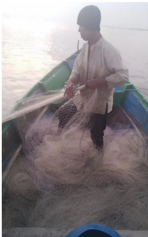
Gb. 3.1 Kondisi nelayan saat proses penarikan jaring menggunakan tenaga manusia

Solusi yang ditawarkan untuk penyelesaian permasalahan yang dihadapi mitra adalah dengan menerapkan Mekanisasi pada kegiatan nelayan di Desa Deluk Kecamatan Bantan yaitu dengan pembuatan 1 unit alat penarik jaring nelayan dengan penggerak motor bensin dengan gear box sebagai robot penarik jaring. Adapun konstruksi alatnya dapat dilihat dari gambar di bawah ini