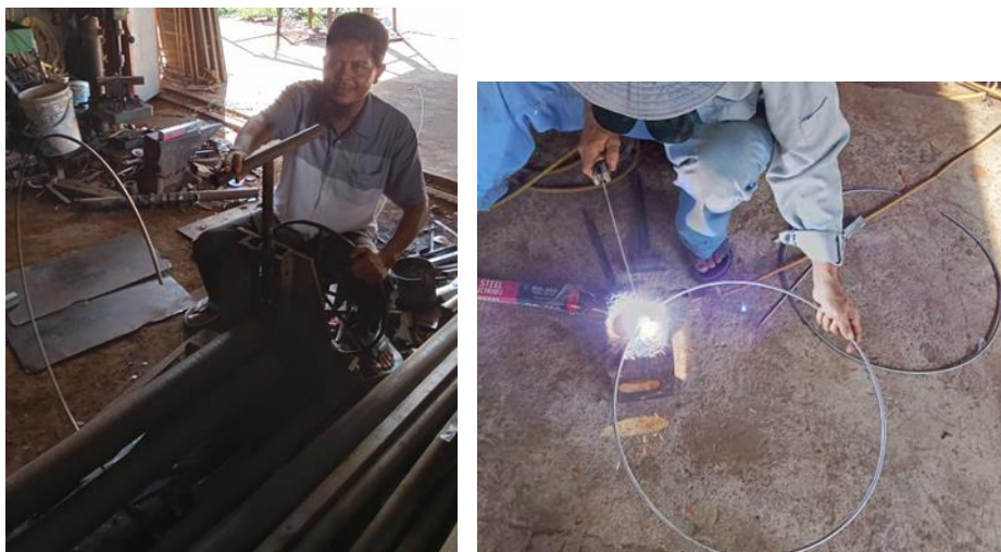
Gambar 3.3 Proses pengelasan penguat lingkaran roller karet penarik dari bahan stainless steel 304 berdiameter 500 mm

Pada proses ini beberapa tahapan pengerjaan yang dilakukan mulai dari proses pemotongan bahan, proses pembentukan bahan, proses pembubutan, milling dan proses pengelasan. Selanjutnya proses penghalusan, pengecatan dasar dan tahapan proses perakitan alat bantu penarik jaring nelayan. Proses selanjutnya dilakukan penyerahan produk pengabdian ke mitra.