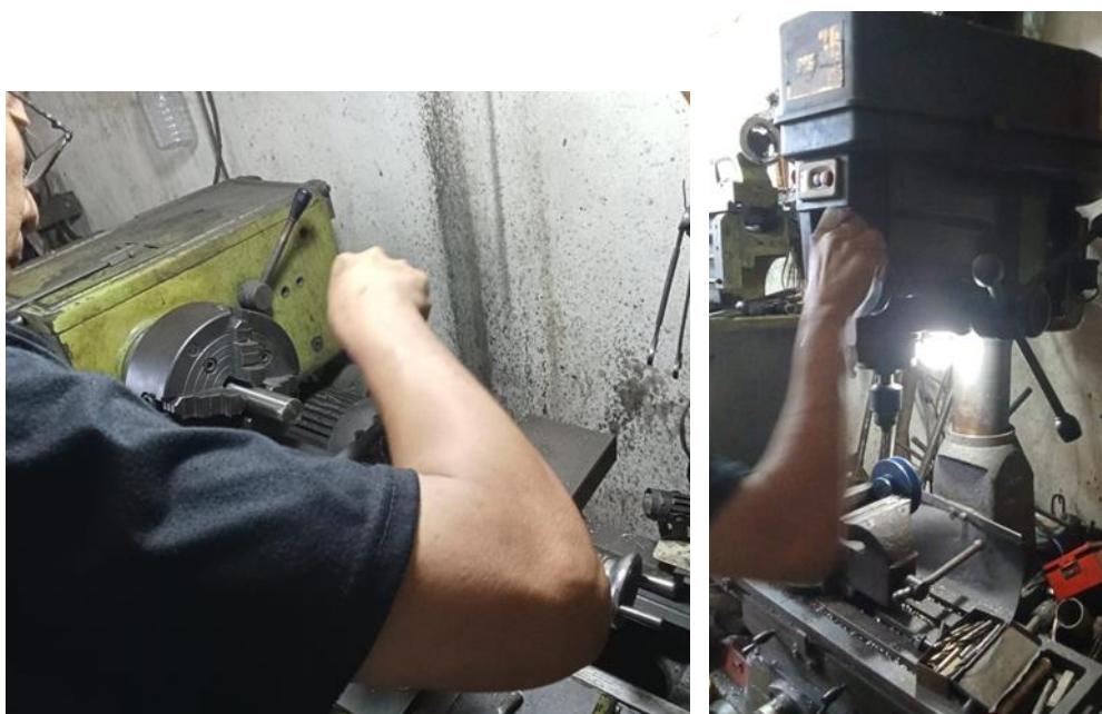
Gambar 3.4 Proses pembubutan poros roller penarik dari bahan stainless steel 304 berdiameter 31 mm dan pembuatan alur pasak pada puli