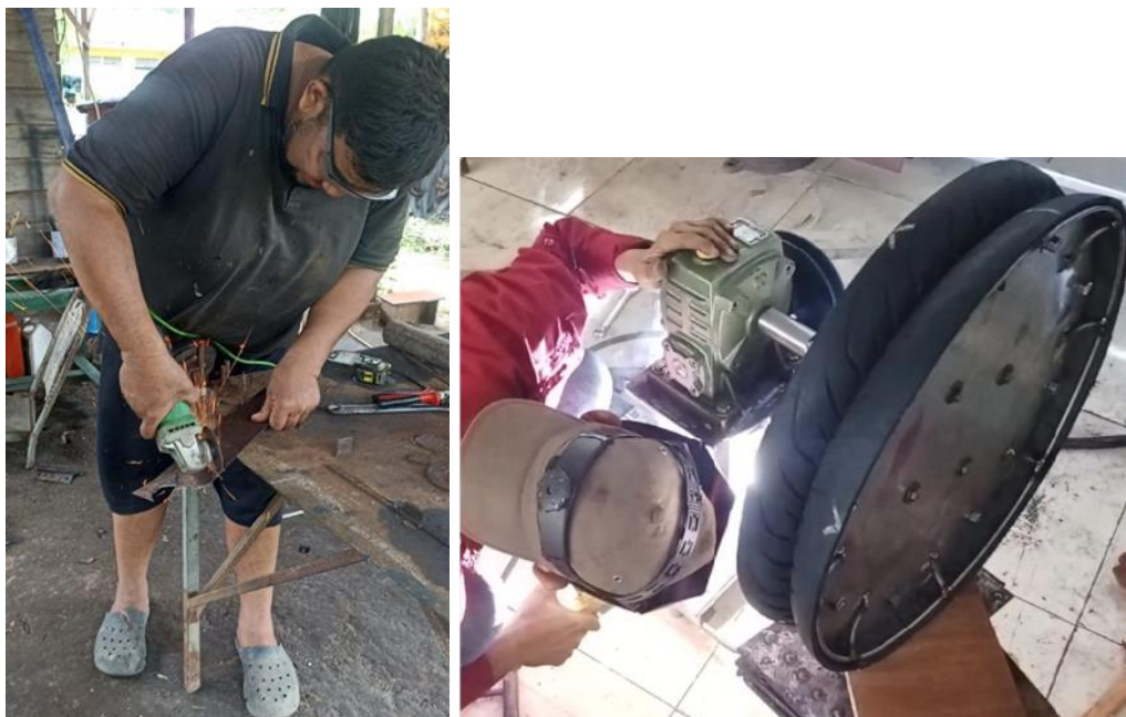
Gambar 3.5 Proses pengerindaan tiang utama roller penarik dan pengelasan tiang utama