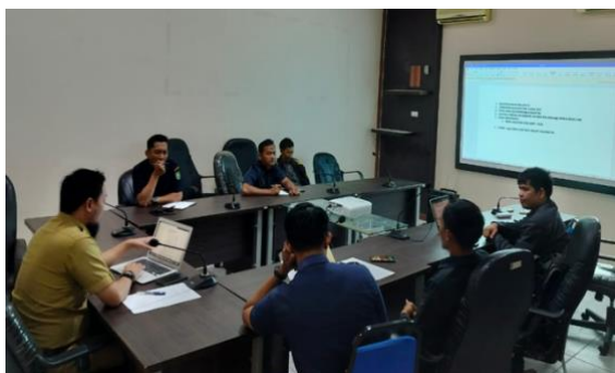
Gambar 3. Sosialisasi Fitur Baru

Keberhasilan sebuah sistem informasi tidak hanya bergantung pada kehandalan teknologi, tetapi juga pada kesiapan penggunanya. Oleh karena itu, setelah sistem selesai dikembangkan, dilakukan tahap implementasi yang melibatkan pendampingan intensif kepada operator di 136 desa se-Kabupaten Bengkalis. Pendampingan ini bertujuan untuk memastikan operator mampu menggunakan fitur-fitur baru serta melakukan pemutakhiran data yang dibutuhkan oleh DPMD. Fokus utama pada tahap ini adalah memandu operator desa melakukan update data perangkat desa untuk periode tahun 2025, guna menjamin validitas database kepegawaian desa.