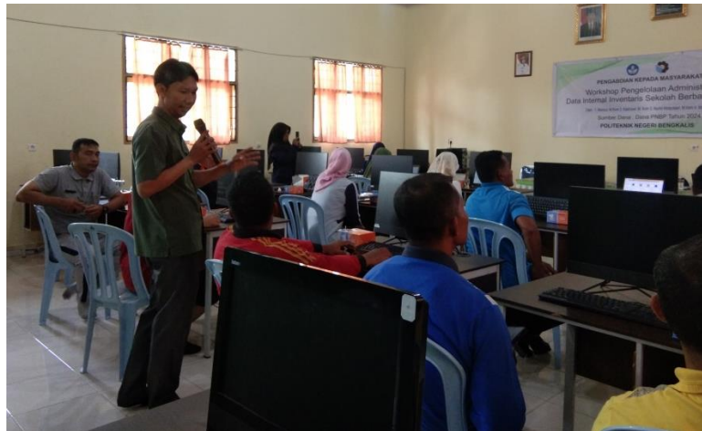
Gambar 5. Teori dan Praktik Workshop Pengelolaan Data Inventaris

Workshop yang dilaksanakan terkait dengan pengelolaan data inventaris sekolah secara online berhasil diikuti oleh operator dan tendik. Mereka mampu mengoperasikan sistem dengan baik sesuai fungsi dan kebutuhan sistem. Meskipun praktik workshop tidak lama, namun kegiatan ini memberikan manfaat dan pemahaman yang besar kepada peserta, terutama dalam mengelola inventaris-inventaris yang ada disekolah. Adapun kegiatan pengabdian ini telah dipublikasikan di media massa elektronik yaitu Bengkalisnews dengan judul “Perkuat Sistem Pengelolaan Inventaris Sekolah, Dosen Polbeng Lakukan Workshop Administrasi Data” yang dapat diakses pada link https://shorturl.at/KUASw . Adapaun bukti berita tersebut ditunjukkan pada Gambar 6.