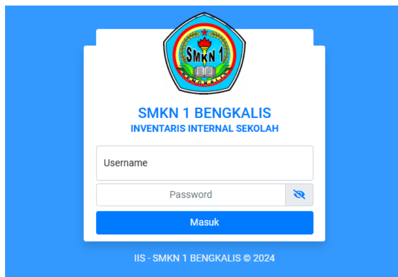
Gambar 3. Halaman Login Aplikasi

Hasil dari pengabdian ini adalah Aplikasi Administrasi Data Internal Inventaris Sekolah Berbasis Online yang merupakan layanan pencatatan dan kontrol untuk melakukan pengendalian terhadap data internal inventaris baik berupa barang habis pakai, barang yang pinjam dan barang yang diserahkan kepada bagian sekolah yang membutuhkan sehingga mempermudah proses pelaksanaan aktivitas sekolah. Penerapan aplikasi tersebut perlu dilakukan sosialisasi, identifikasi kebutuhan data dan informasi sekolah, konfigurasi sistem, pelatihan/Bimtek, membuat buku panduan secara offline, dan melakukan monitoring pengguna aplikasi. Sistem aplikasi tersebut diinstall pada server online sehingga dapat dipakai sesuai kebutuhan masing-masing sekolah, untuk versi online dapat diakses melalui halaman web https://iis.smkn1bengkalis.sch.id/keluards (SMK Negeri 1 Bengkalis).