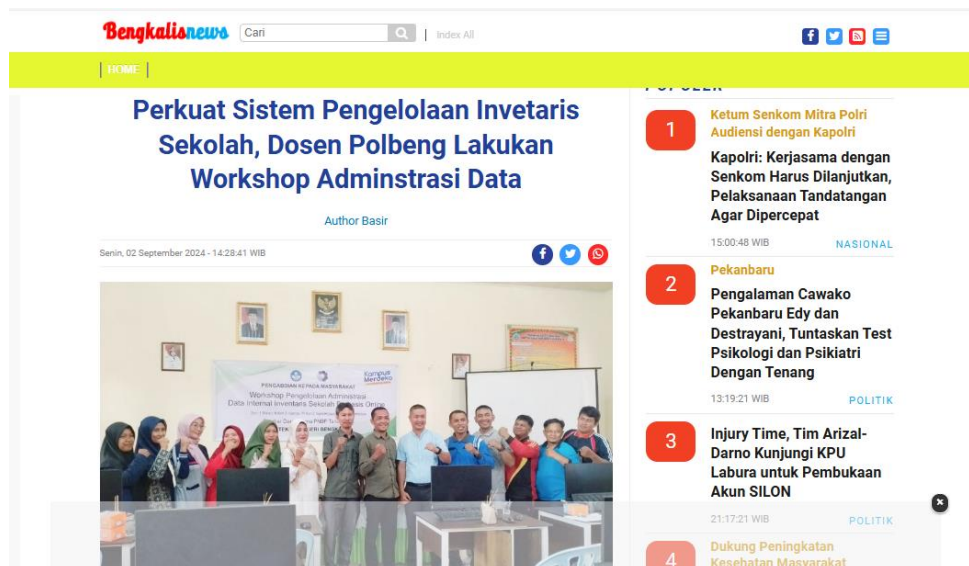
Gambar 6. Publish Berita Kegiatan Workshop Pengelolaan Inventaris