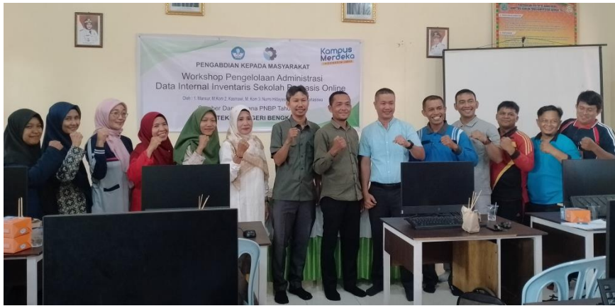
Gambar 4. Foto Bersama Kegiatan Workshop Pengelolaan Data Inventaris