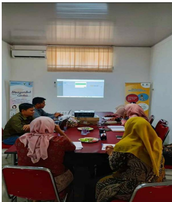
Gambar 1. Kegiatan Pengabdian memberi pelatihan kepada admin dinas koperasi dan umkm kabupaten Bengkalis

Hasil dari program ini berupa portal informasi resmi Diskop UKM Kabupaten Bengkalis yang beralamat di domain (contoh: https://diskopukm.bengkalis.go.id ). Portal ini telah aktif digunakan untuk menyebarkan informasi kegiatan, program bantuan, dan jadwal pelatihan kepada masyarakat. Fitur yang tersedia antara lain: Beranda Interaktif: Menampilkan informasi terbaru dalam bentuk slider dan feed berita. Layanan Online: Formulir pendaftaran pelatihan, bantuan usaha, dan konsultasi koperasi. Direktori UMKM: Menampilkan profil usaha kecil menengah di wilayah Kabupaten Bengkalis. Sistem Admin: Memungkinkan pengelola untuk memperbarui konten, memverifikasi data UMKM, dan merespons aduan masyarakat.